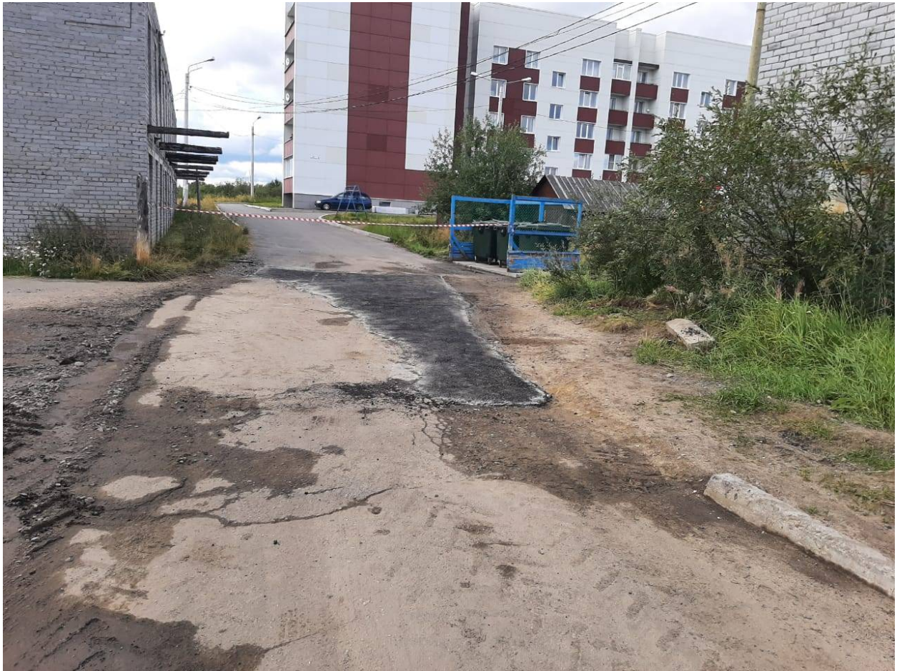
1. Снятие деформированного слоя асфальтового покрытия