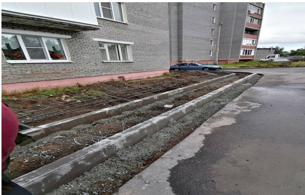
1.6. Монтаж малых архитектурных форм