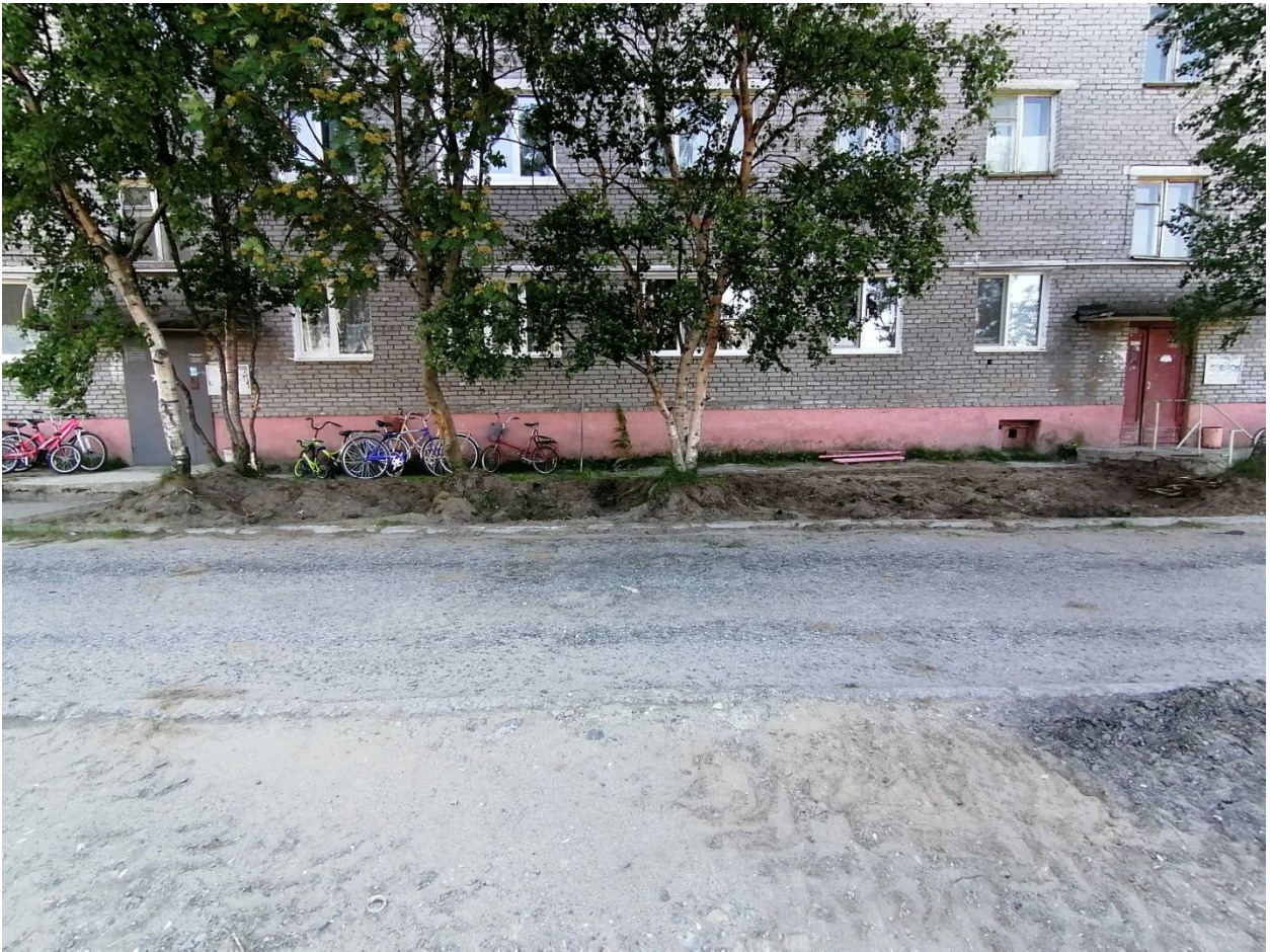
1.4.Снятие верхнего слоя грунта