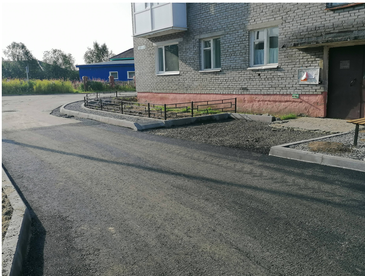
После завершения работ