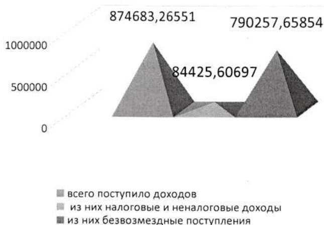
Таблица № 1. Структура исполнения доходной части бюджета муниципального образования Ловозерский район по состоянию на 01.01.2021 года (тыс.руб.)

Структура доходов бюджета муниципального образования Ловозерский район выглядит следующим образом: