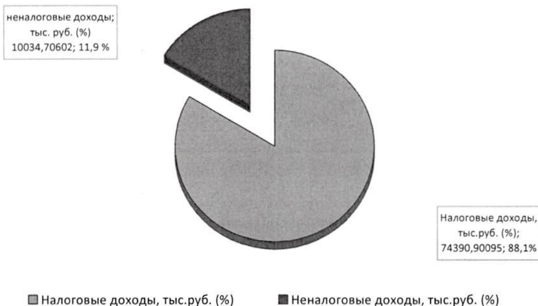
Таблица № 2. Структура налоговых и неналоговых доходов по исполнению бюджета муниципального образования Ловозерский район по состоянию на 01.01.2021 года

В структуре собственных доходов налоговые доходы составляют 88,1 процентов, выполнение их составило 74 390,90095 тыс.рублей, при утвержденном плане 75 932,55 тыс.рублей. Налоговые доходы бюджета муниципального образования Ловозерский район получены за счёт 4-х источников (таблица № 3).